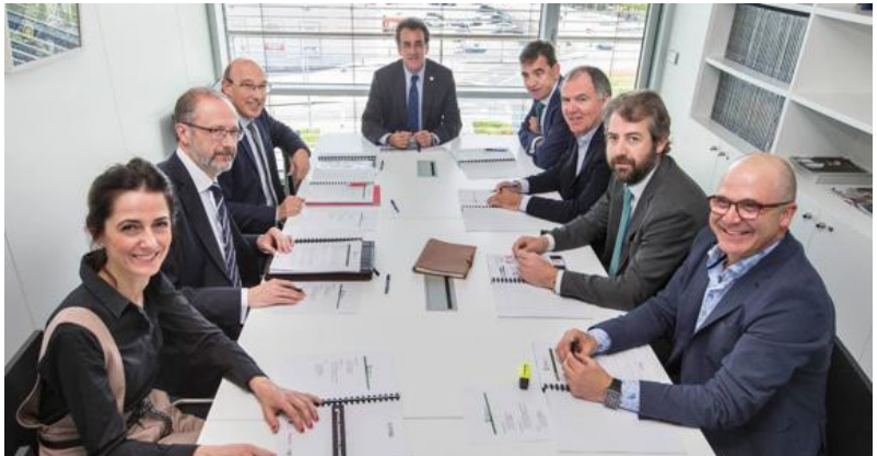
El jurado deliberaba sobre las propuestas presentadas por los expertos.

Falta mucho todavía para tener una 'start up' de bandera con los números millonarios de empresas como Facebook –o sea, un unicornio en la jerga